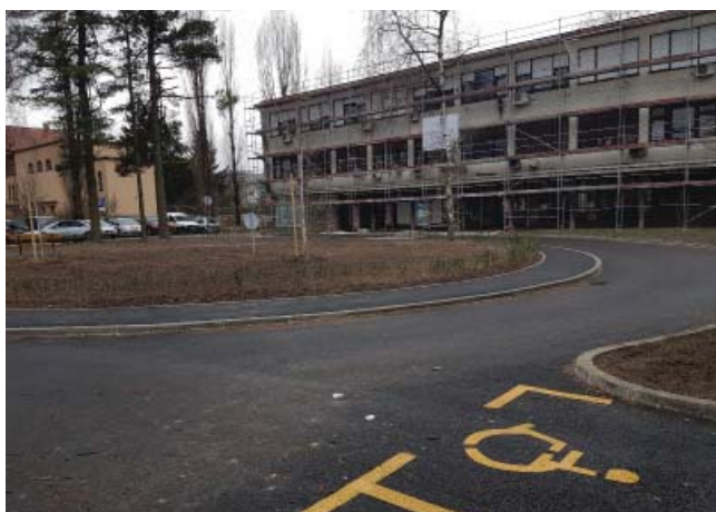
_ Dom zdravlja Kruge uređivanje pristupnih prometnica