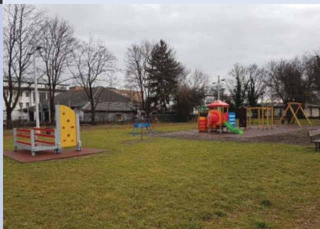
Osnovna škola "Grigor Vitez" _ uređivanje dječjeg igrališta