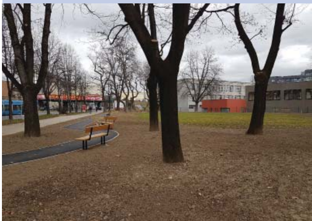
_ Park 5. studenoga uređivanje parka